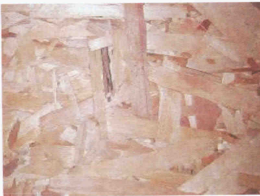
Obr. 8 Plošná struktura OSB desky

OSB desky (Oriented Strand Board / Oriented Structural Board) byly vyvinuty ve 40. letech dvacátého století v Německu, ale největšího rozšíření výroby dosáhly v USA. Vyvinuly se z desek Waferboard s plochými čtvercovými třískami délky max. 75 mm a tloušťky 0,5 mm (= wafers). OSB desky jsou velkoplošné desky z orientovaných velkoplošných třísek – pásků (= strands). Vyrábějí se nejčastěji třívrstvé, méně pětivrstvé. Krajiní vrstvy mají pásky orientovány rovnoběžně s podélnou osou desky, vnitřní vrstva (tvoří 50 % tloušťky) má pásky orientovány kolmo. Rozměry pásků jsou: délka 60-150 mm, šířka 5-15 mm, tloušťka 0,4-0,6 mm. Materiálem pásků jsou nejrůznější dřeviny: v USA je to převážně jižní borovice, tulipánovník, javor; v Kanadě je to hlavně topol; v Evropě jsou to zejména jehličnany – zvláště borovice. Lepidla se používají v tekuté (fenolformaldehydová) nebo v práškové formě (izokyanátová). Po nanesení lepidla se desky lisují za současného působení tepla. Hustota OSB desek je 600-800 kg/m 3 . Tloušťka desek se pohybuje nejčastěji v rozmezí 6 – 25 mm. Oproti dřevu rostlému a lepenému lamelovému, které se používají pro prvky nosné, OSB desky jsou užívány především jako prvky vyplňové a prvky zajišťující prostorovou tuhost konstrukce.