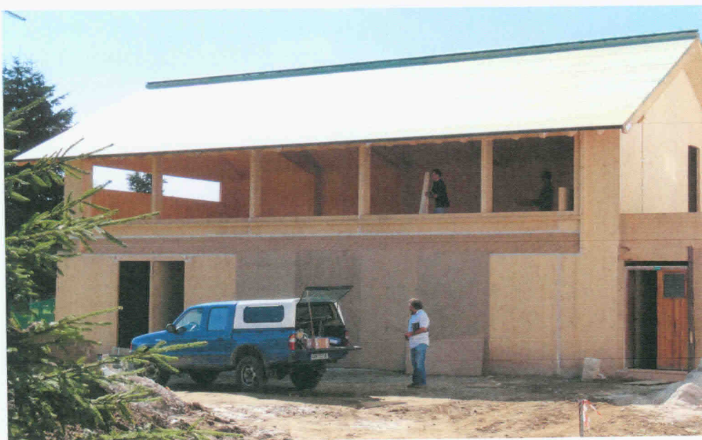
Obr. 7 Příklad dřevostavby z masivních CLT panelů

V posledním desetiletí se u dřevostaveb zejména v Německu a Rakousku začíná prosazovat v konstrukci dřevostaveb (zejména vícepodlažních) nový kvalitní masivní plošný dřevěný prvek – CLT/KLH (Cross-Laminated-Timber/Kreuz-Laminierten-Holz), který je vyráběn slepením lichého počtu vrstev prken, či fošen (tl. 19 až 40 mm) jehličnatých dřevin (nejčastěji smrku). Vzniká takto konstrukční deska o tloušťce max. 500 mm, šířce max. 2,95 m a délce max. 16,5 m. Tyto desky mají velmi dobré pevnostní i přetvárné vlastnosti a nosné prvky z těchto desek mají též poměrně vysokou požární odolnost. Jejich masivnímu rozšíření však prozatím brání jejich poměrně vysoká cena a výrobní náročnost.