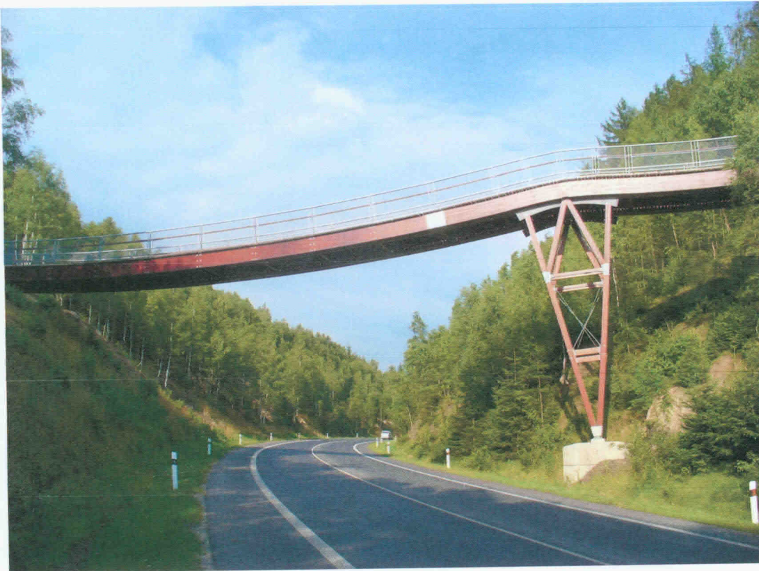
Obr. 6 Lávka Rádlo (2005) z LLD