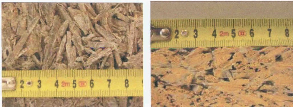
Obr. 10, 11 Plošná a příčná struktura cementoštěpkových desek