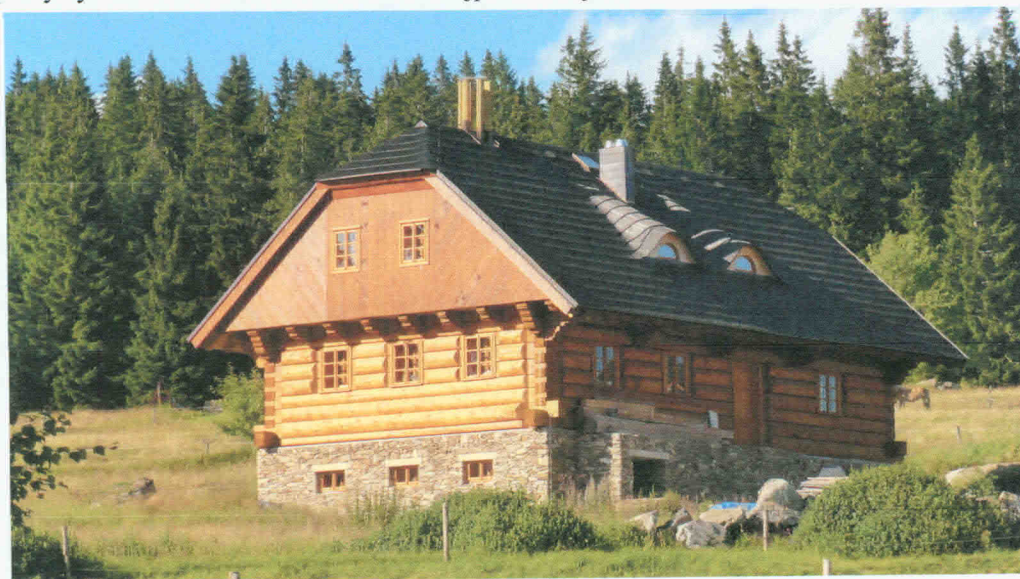
Obr. 1. Příklad použití dřevěné kulatiny v konstrukci dřevostavby-srubu

Vedle rostlého dřeva ve formě kulatiny (obr. 1) a hraněného řeziva tak dnes nachází stále širší uplatnění v dřevostavbách a dřevěných konstrukcích obecně i lepené lamelové dřevo a řada aglomerovaných materiálů na bázi dřeva (překližky, vrstvené dřevo z dýh, ale také tyčové a zejména deskové prvky ze zkřížených prken, dále z třísek a vláken). V následujícím textu jsou stručně popsány vybrané charakteristické vlastnosti nepoužívanějších materiálů na bázi dřeva.