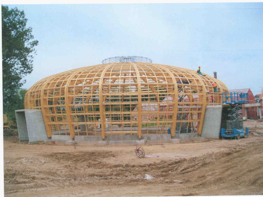
Obr. 4 Zastřešení jízďárny prvky z LLD