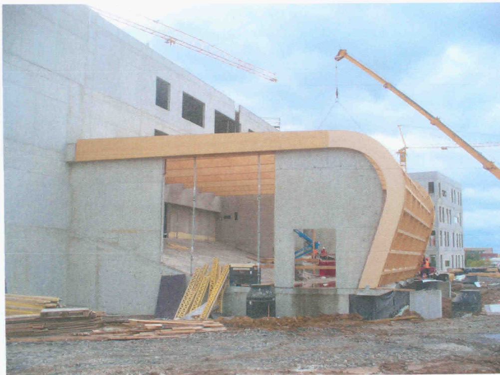
Obr. 3 Zastřešení posluchárny FEI VŠB-TUO nosníky z LLD