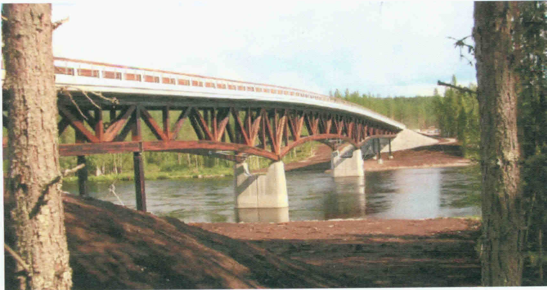
Obr. 5 Jeden z nejúnosnějších dřevěných mostů v současnosti přes řeku Reno (Norsko, 2006)