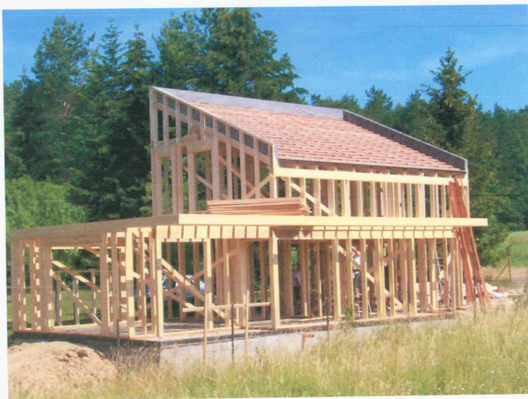
Obr. 2. Nosná konstrukce dřevostavby ve sloupkovém systému z rostlého dřeva